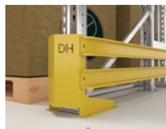
Detalle defensa RACKS SELECTIVOS