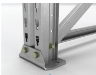
Detalle pie de apoyo