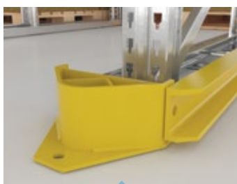
Detalle defensa RACKS PENETRABLES